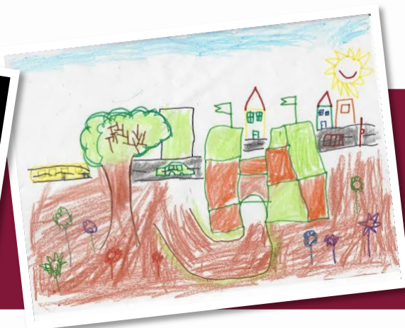
מענדי רבין כיתה א'