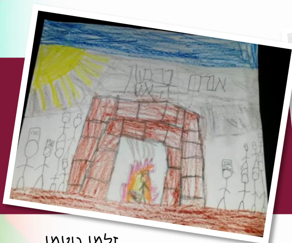
זלמן בוטמן כיתה ב'