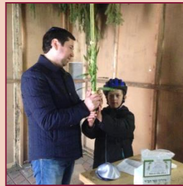
ילדי כיתה ג' במבצעי חודש תשרי